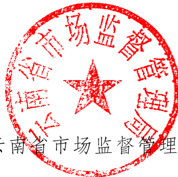
云南省市场监督管理局